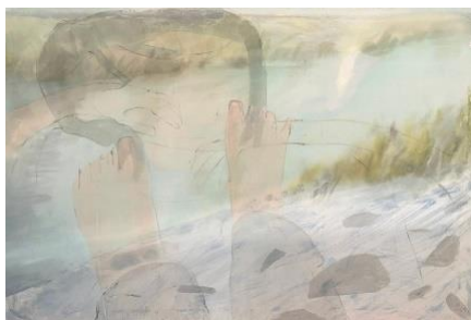
岡部憲明アーキテクチャーネットワーク賞 田村 美琴 「視線で歩く（ひとやすみ）」