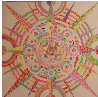
アーバネットコーポレーション賞 悟 空 「太陽」