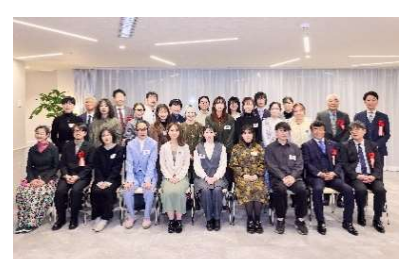
参加者の記念撮影