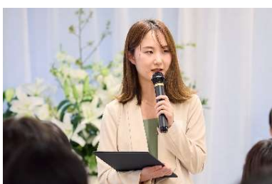
受賞者のコメント