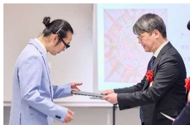
小堀社長より表彰状と賞牌、賞金目録を授与