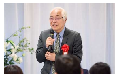
受賞者にコメントを述べる協賛企業