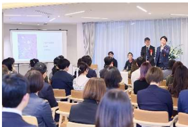
チャームスイート豪徳寺で開催