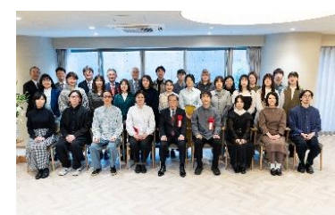
参加者の記念撮影