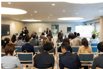
チャームスイート西新宿で開催