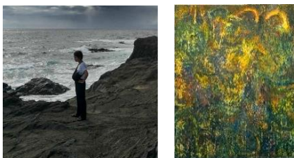
グランプリ「ナトリウム灯が全て隠す」

この作品は一目見てわかりやすい絵ではないかと思いますが、その分見る度に違う楽しみ方ができる絵ではないかと思っています。ご入居者様方に長く楽しんで頂けたら幸いです。