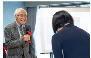
受賞者にコメントを述べる協賛企業