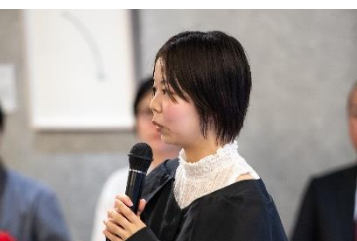
受賞者のコメント