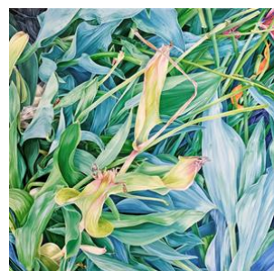
東京メトロ都市開発賞