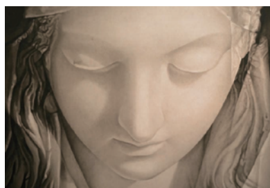
香久山 雨【Ask, and you will receive】 2022年～2023年、803×1,000