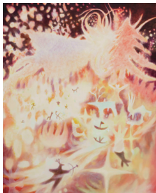
田野 勝晴 【エデンの母たち】 2023年、930×747