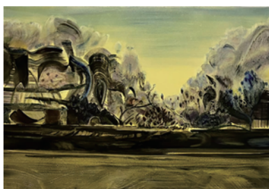
牧野 優希【春暁】 2023年、1,167×727