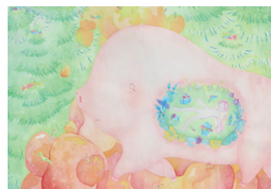
朱 婷鈺【暖かいお腹】 2022年、1,050×780