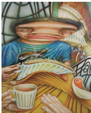
角谷 友里恵 【おはよう】 2023年、1,000×803