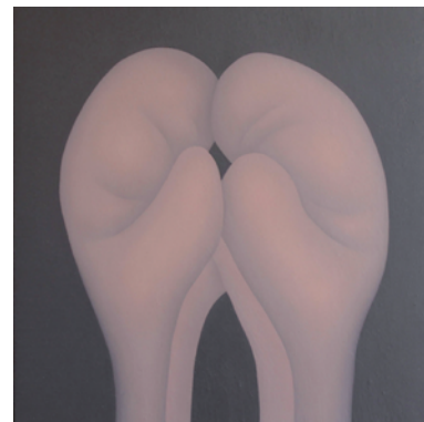
西田 純 【G20】 2021年、314×307