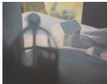
日建ハウジングシステム賞 福濱 美志保「Once in a Lullaby」