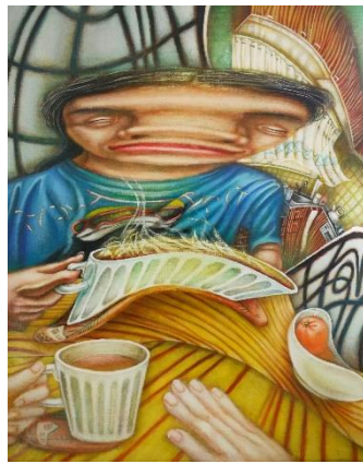
社長賞 角谷 友里恵「おはよう」