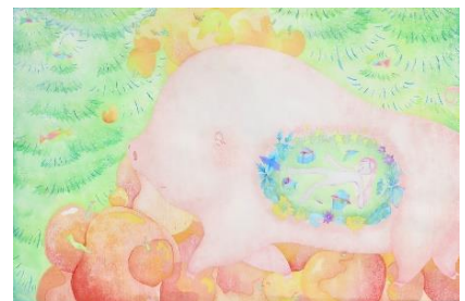
ヒューリック賞 朱 婷钰「暖かいお腹」