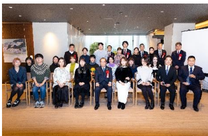
参加者の記念撮影