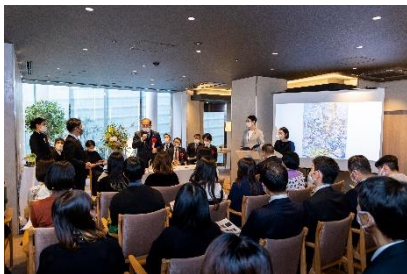
チャームプレミア御殿山参番館で開催