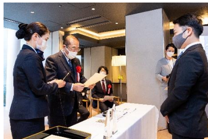
下村社長より表彰状と賞牌、賞金目録を授与