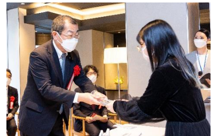
協賛企業よりコメントを受ける受賞者