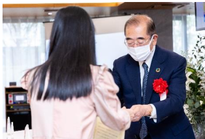
下村社長より表彰状と賞牌、賞金目録を授与