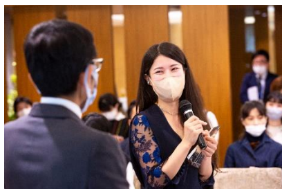
協賛企業よりコメントを受ける受賞者