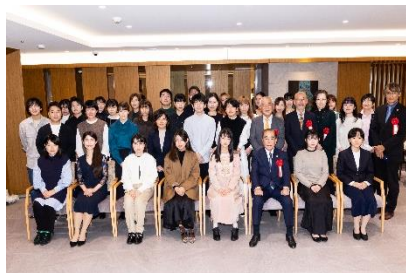
参加者の記念撮影