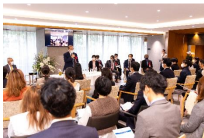
チャームプレミアグラン御殿山式番館で開催