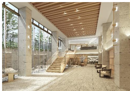
チャームプレミア グラン 御殿山 貳番館 エントランス完成予想図