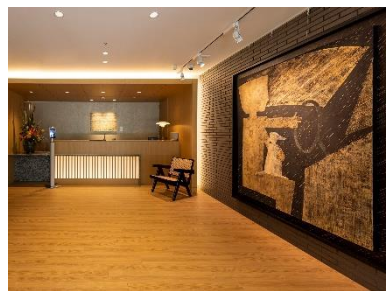
「アートギャラリーホーム」の様子

「This is MECENAT」は、多様な企業メセナ(芸術文化を通じて豊かな社会づくりに貢献する活動)を顕在化し、各地に点在する創意工夫に満ちた活動の数々を明らかにしその社会的意義や存在感を示すことを目的として、2014年に公益社団法人企業メセナ協議会が創設した認定制度です。（後援：文化庁）