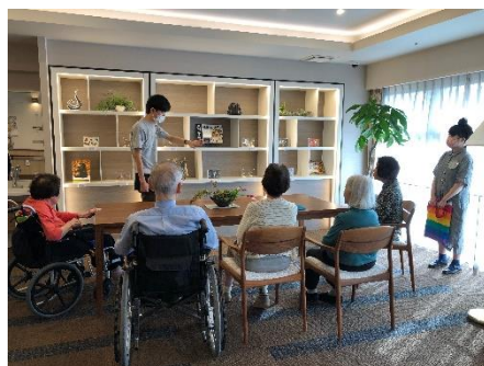
アートプログラムの様子

アーティストの若い感性がご入居者様の意欲とQOL向上に働きかけ、また若いアーティストにとってはコミュニケーションと新たな創作活動の原動力となるよう引き続き取り組んでまいります。