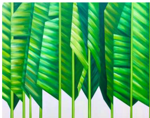
渡部 未乃【Traveler's tree】2021年、805×1,000mm

株式会社チャーム・ケア・コーポレーションの文化支援事業である本展は、2014年より開始したアートギャラリーホーム事業の第19回作品募集を迎えるにあたり、今回初めての開催に至りました。