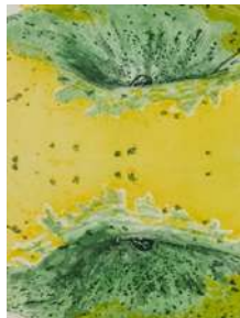
大久保 春霞【Les yeux】 2020年、900×630mm