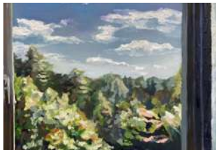
野田 将太【いい天気ですね】 2021年、500×727mm