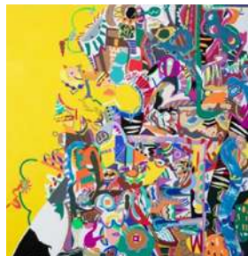
イモトサユリ【freedom 自由】 2019年、1,167×1167mm