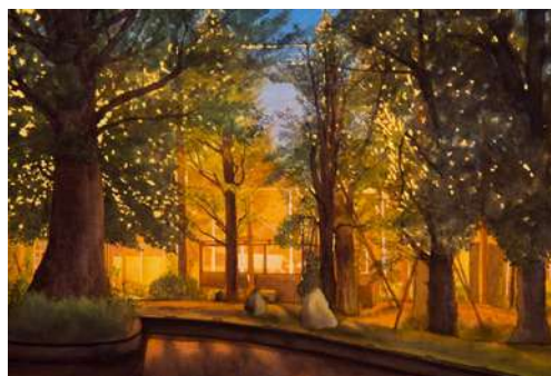
CAI QIN【宵の秋】 2020年、500×652mm