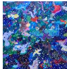
星 きさら【鳥がみている空】 2021年、910×910mm