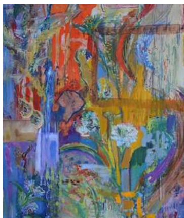
佐藤 芹香【Garden】 2021年、910×727mm