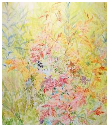
田澤 苑実【花色草】 2021年、606×500mm