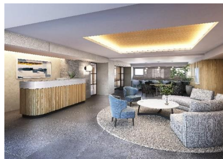
チャームスイート経堂 エントランス完成予想図

第18回アートギャラリーホーム作品募集では、229作品の応募がありました。審査で選出された作品が、チャームスイート経堂とチャームプレミアグラン御殿山のホーム内に展示される予定です。